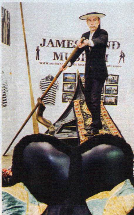
I en gondol av den här typen färdades James Bond i filmen Moonraker , från 1979.